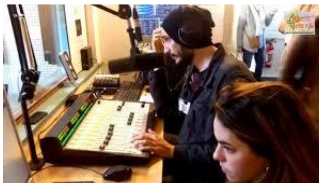
Dans le studio de Radio Alliance.

Radio Alliance a été fondée dans les années 1980 par quelques Églises évangéliques dans l'agglomération de Nîmes. Le conseil régional a mis à disposition une fréquence au profit de la culture dite protestante, et des subventions. Malheureusement, en raison de toutes sortes de difficultés, ces Églises se sont toutes retirées en 2001, après quoi l'Église réformée de Nîmes a repris la chaîne. Alors, un autre vent théologique a commencé à souffler.