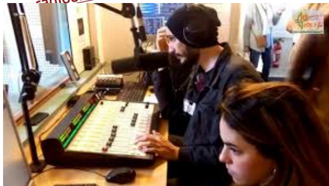
Dans le studio de Radio Alliance.

Radio Alliance a été fondée dans les années 1980 par quelques Églises évangéliques dans l'agglomération de Nîmes. Le conseil régional a mis à disposition une fréquence au profit de la culture dite protestante, et des subventions. Malheureusement, en raison de toutes sortes de difficultés, ces Églises se sont toutes retirées en 2001, après quoi l'Église réformée de Nîmes a repris la chaîne. Alors, un autre vent théologique a commencé à souffler.