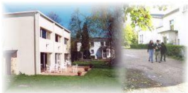
Gebouwen van de Evangelische Theologische Faculteit in Vaux-sur-Seine

initiatief, terwijl sommigen daarnaast ook nog een deeltijdbaan in de samenleving hebben.