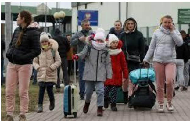
Oekraïense vluchtelingen bij de grens met Polen

Daarbij denken we allereerst aan de bevolking in Oekraïne en omliggende landen, maar de stijgende energie- en voedselprijzen maken ons wel duidelijk dat we allemaal getroffen gaan worden door de gigantische economische en politieke schokgolven die deze oorlog teweegbrengt, over de hele wereld.