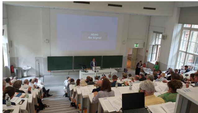
Het auditorium waar het symposium plaatsvond – 25 lezing van topniveau in nog geen drie dagen tijds!

In dit licht bezien was het symposium een bijzonder gebeuren. Juist in deze stad, waar Joden zoveel geleden hebben, kwamen Messiaans-Joodse, katholieke, protestantse, evangelische en orthodoxe theologen en leiders bijeen voor een dialoog op hoog niveau. Het ging erom dat de 'kerk uit de volken' gaat erkennen dat zij niet volledig is zonder de 'kerk uit de besnijdenis' en de Joodse expressie van het geloof in Jezus-Messias, en dat zij wezenlijk verbonden is met het hele Joodse volk. Niet alleen via de Jezusgelovige Joodse broeders en zusters, maar vooral via Jezus zelf, die de Messias van heel het volk Israël is. In dat licht bezien is de vervangingsleer dat de kerk in de plaats van Israël is gekomen onhoudbaar, maar kunnen we ook niet zeggen dat er twee wegen van verlossing zijn, de ene voor Israël via de Torah, de andere voor de volken via Jezus Messias. De ene Messias is de Verlosser van beide.