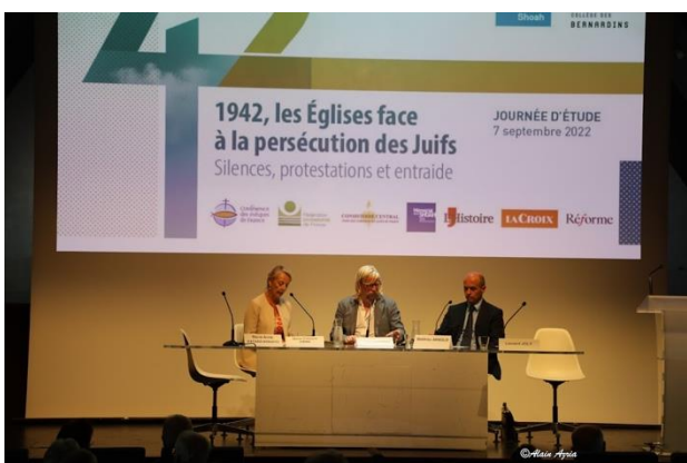
Collège des Bernardins, gebouwd in de 13 e eeuw. De studiedag vond plaats in de ruimte onder het dak.

Een keur van historici belichtte de dubbele rol van de Rooms-katholieke kerk ten aanzien van de Jodenvervolgung. Terwijl de paus en de nationale hiërarchie zwegen en zich onthielden van actief verzet, kwamen enkele individuele bisschoppen en plaatselijke pastoors wel in verzet. Dat stak sterk af tegen de rol van de Franse protestantse kerken: deze waren unaniem in hun openlijke stellingname en in het daadwerkelijk helpen van Joodse slachtoffers.