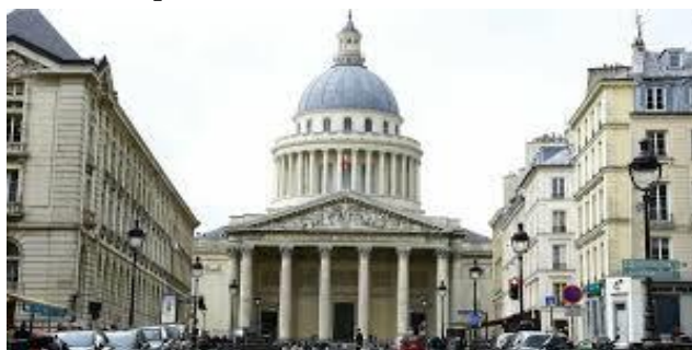
Het Panthéon, een voormalige RK kerk, is thans een seculier 'heiligheid'. Rabbin, bisschop en predikant spraken daar een gedenkwaardige verklaring en een gebed uit.