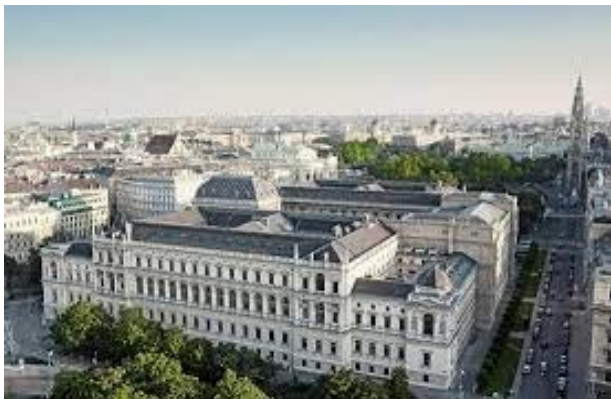
De statige gebouwen van de beroemde Universiteit van Wenen.